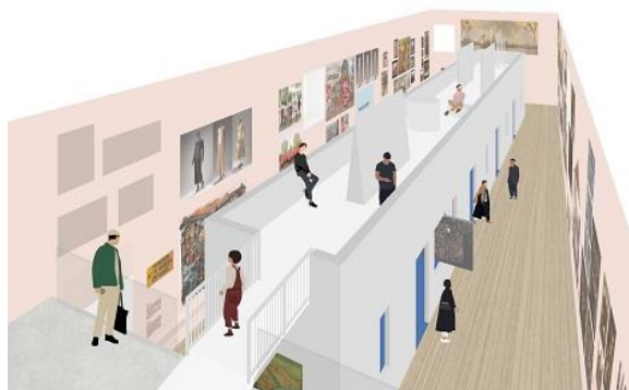
Artist Impression tentoonstelling Panorama Amsterdam. Amsterdam Museum in de Hermitage Amsterdam.