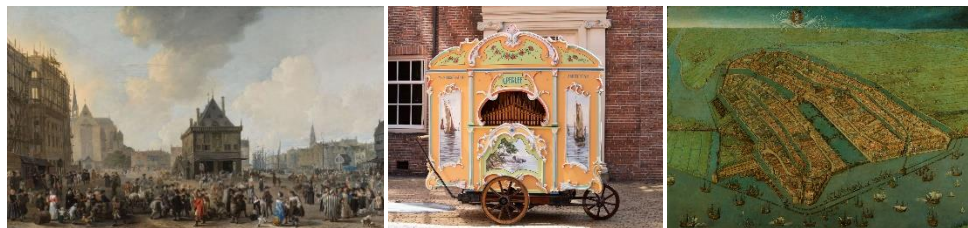
Topstukken uit de collectie van het Amsterdam Museum. V.l.n.r. de Dam van Johannes Lingelbach (1622-1674), draaiorgel 'Het Snotneusje' en Gezicht op Amsterdam in vogelvlucht van Cornelis Anthonisz (ca. 1505-1553)