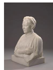
Buste Theodora Haver, Jo Schreve-IJzerman, 1914

Enkele voorwerpen die zich al langer in de collectie van het Amsterdam Museum bevinden maar nog niet vaak het depot verlieten, zijn ook terug te vinden in de collectiepresentatie Panorama Amsterdam . Bijvoorbeeld een 700 kilo wegend marmeren borstbeeld van Dora Haver (1856-1912), dat werd gemaakt in opdracht van de Vereniging voor Vrouwenkiesrecht in 1913. Het werd geschonken aan de stad en geplaatst in het Stedelijk Museum (het is dus al meer dan 100 jaar in de stadscollectie) maar de directeur van het Stedelijk Museum liet de naam van Haver van de sokkel verwijderen omdat hij de kiesrechtstrijd buiten het museum wenste te houden. In 1921 werd de naam weer toegevoegd. Vrouwenkiesrecht was toen een feit.